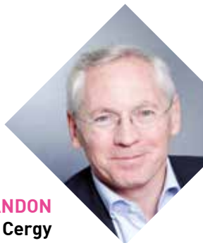
JEAN-PAUL JEANDON Maire de Cergy