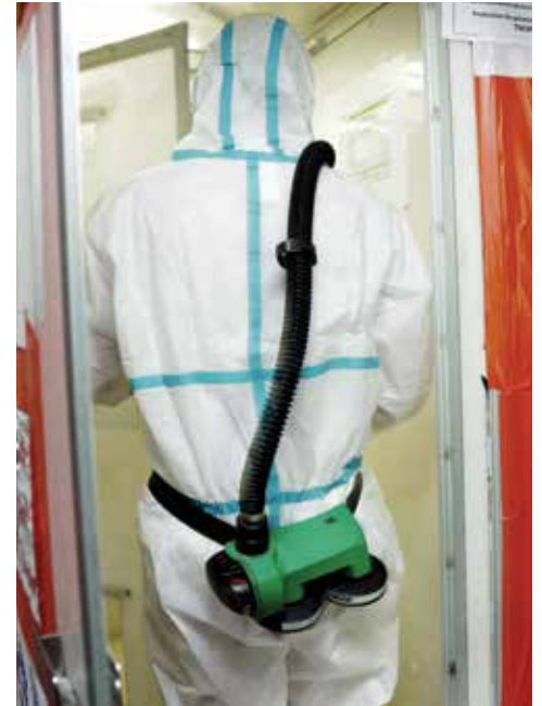
Préparation du matériel avant de rentrer dans la zone confinée de désamiantage

Et puis à la rentrée, ce sera le début... de la construction du «Douze».