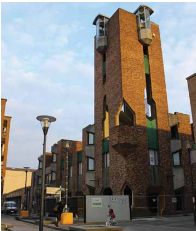
Vue du bâtiment actuel