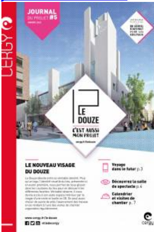
Journal du Douze - 5