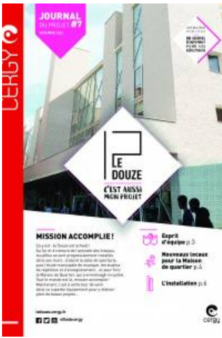
Journal du Douze - 7