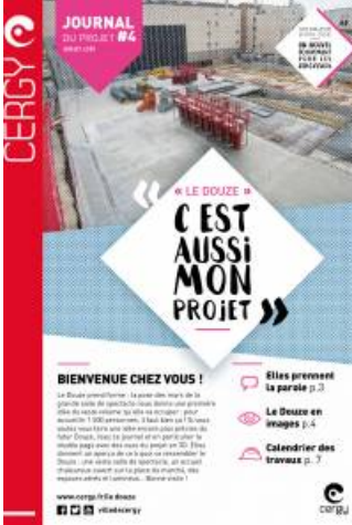
Journal du Douze - 4