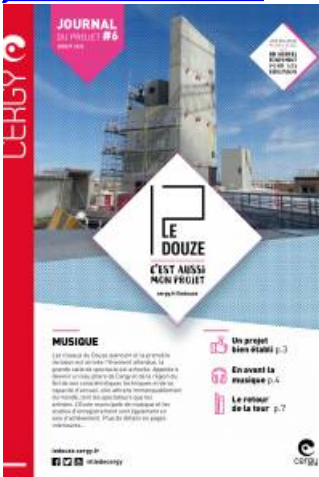
Journal du Douze - 6