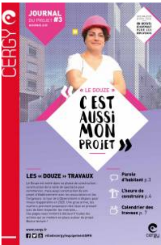
Journal du Douze - 3